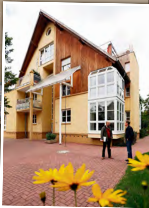
Die 2-Raum-Eigentumswohnung in der Talstraße 32b steht zum Verkauf. Preis: 160 000 Euro, früher über 200 000 Euro