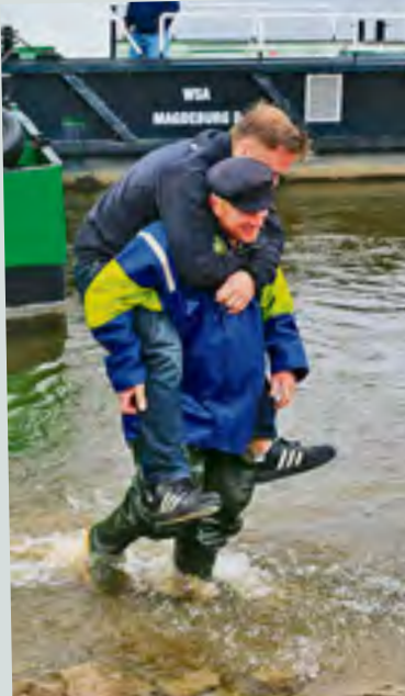
Quaschny half während der Juni-Flut seinen Nachbarn

...weil er half, obwohl er selbst alles verlor