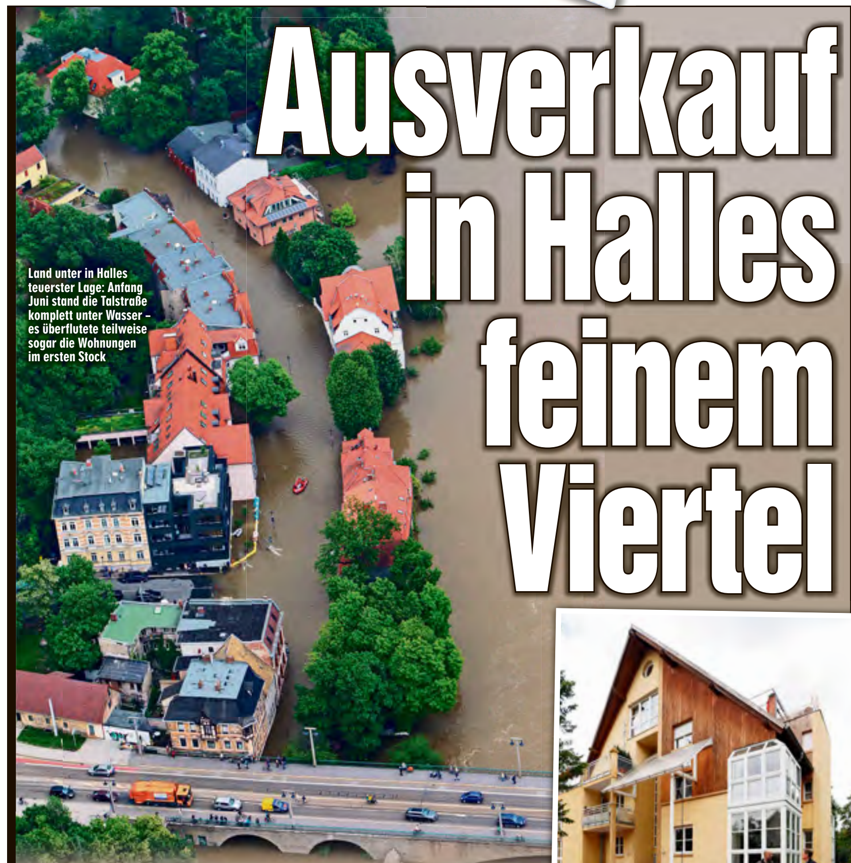
Land unter in Halles teuerster Lage: Anfang Juni stand die Talstraße komplett unter Wasser - es überflutete teilweise sogar die Wohnungen im ersten Stock

Hausschuh-Dieb in Wittenberg Wittenberg - Er brauchte sie eben dringend! Mittwoch, 13.45 Uhr in der Collegienstraße: Ein betrunkener Mann (54) klagt in einem Laden zwei paar Hausschuhe, Wert jeweils 6,99 Euro. Er rennt weg, die Ladenbesitzerin hinterher. Auf dem Kirchplatz erwischte sie ihn, unterdessen ist auch die Polizei schon da. Es wird ein Alkoholpegel von 1,57 Promille gemessen, die begehrten Hausschuhe musste er wieder herausgeben.