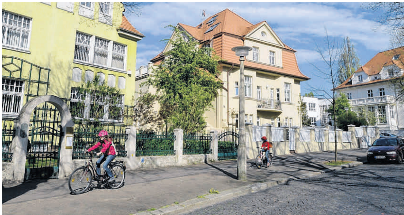
Das Paulusviertel gehört zu den attraktivsten Wohnlagen.

HALLE/MZ - Wenn es nach dem Willen der CDU-Stadtratsfraktion geht, dann gibt es bald freies Internet per W-Lan in den halleschen Straßenbahnen. In einer Anregung fordert die Fraktion, dass die Verwaltung mit der Havag über ein entsprechendes Pilotprojekt verhandeln soll. Freies Internet würde die Havag attraktiver machen und damit wohl zu steigenden Fahrgastzahlen führen.